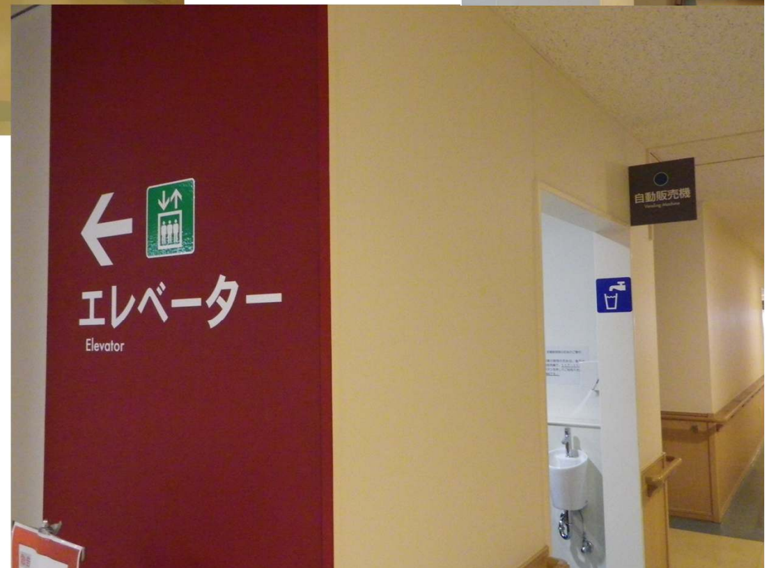
エレベーターと水 飲み場の掲示