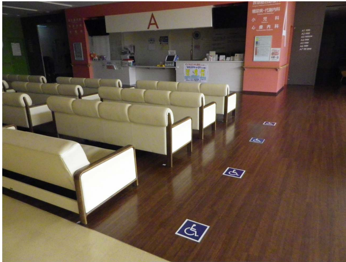
外来待合室に車いす スペース確保