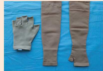
弾性着衣 (グローブ、スリーブ)