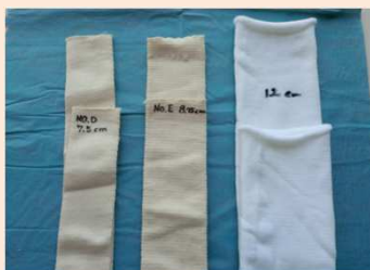
圧迫力がある筒状包帯